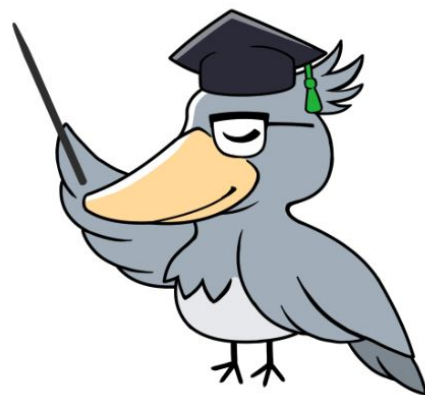
ハシビロコウ博士

大きな頭に詰め込んだ知識と鳥瞰を活かし、的確なアドバイスをする。趣味はボウリング。